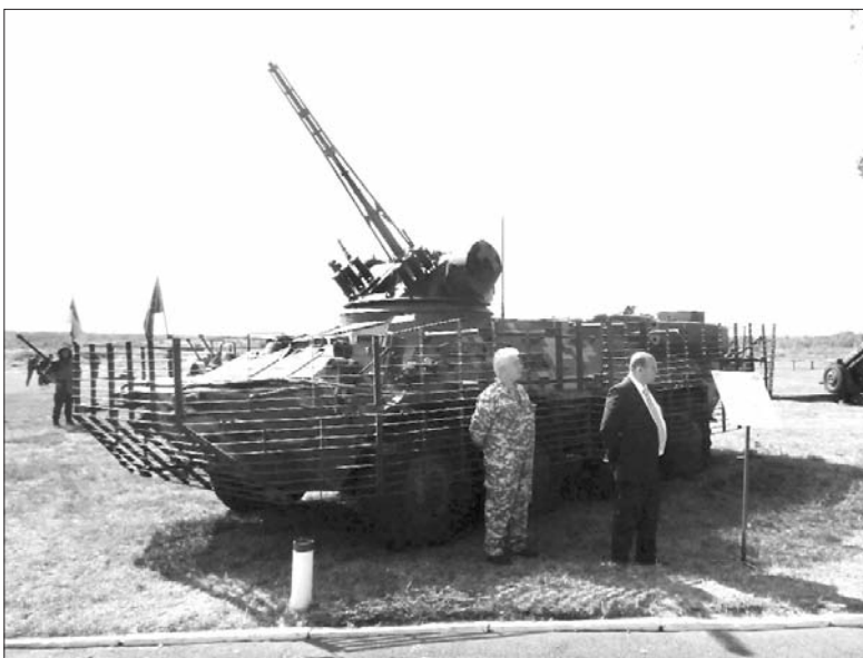
І кілька БТР 3Е1 з протикумулятивними екранами.